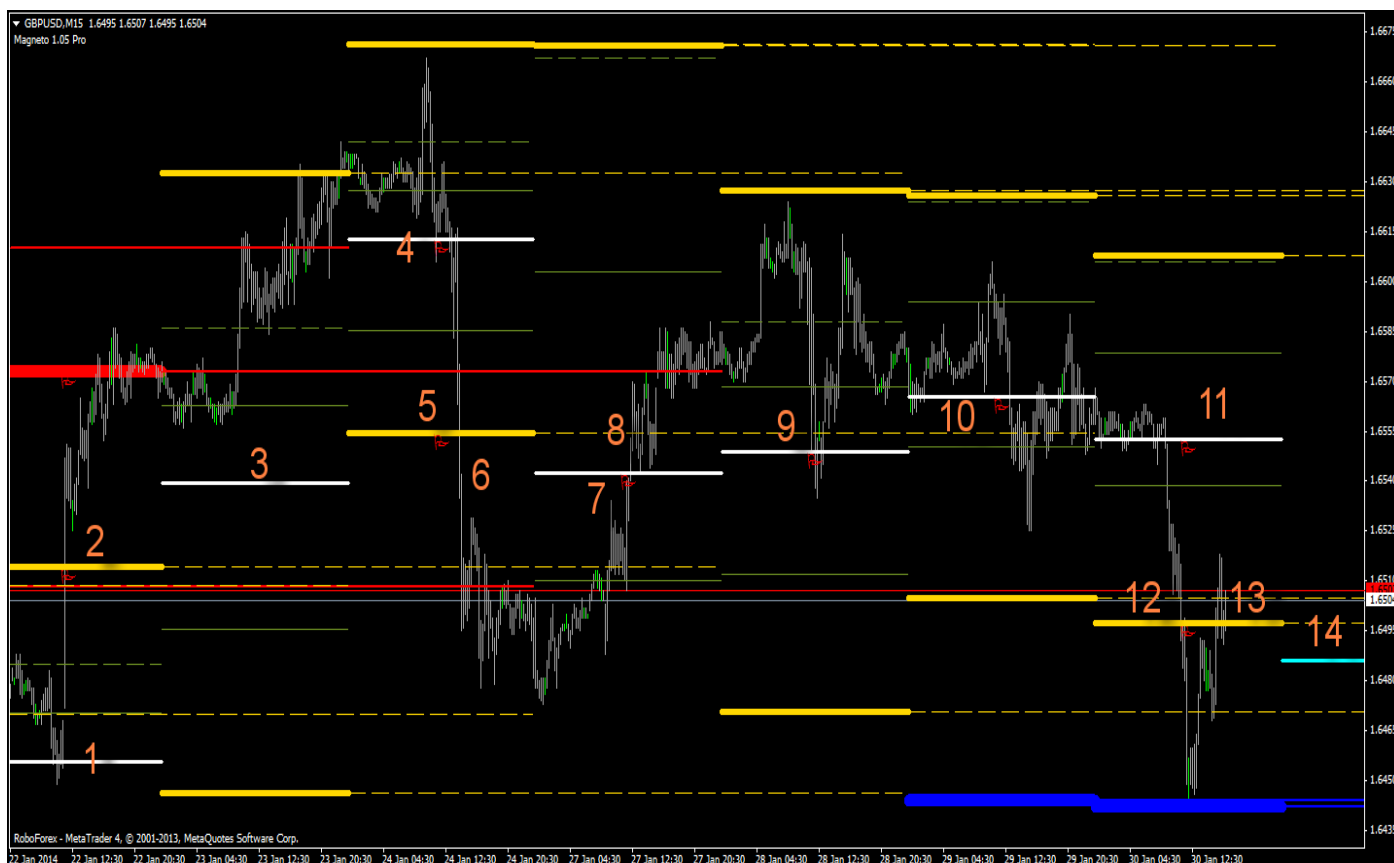
График пары GBPUSD 15 минут, индикатор Magnet Pro .